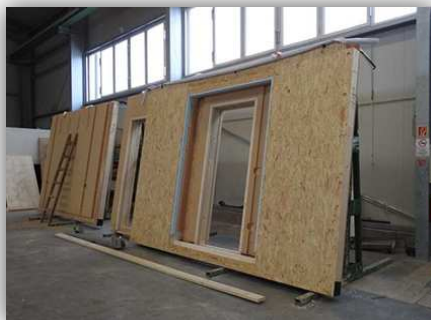
Külső és belső